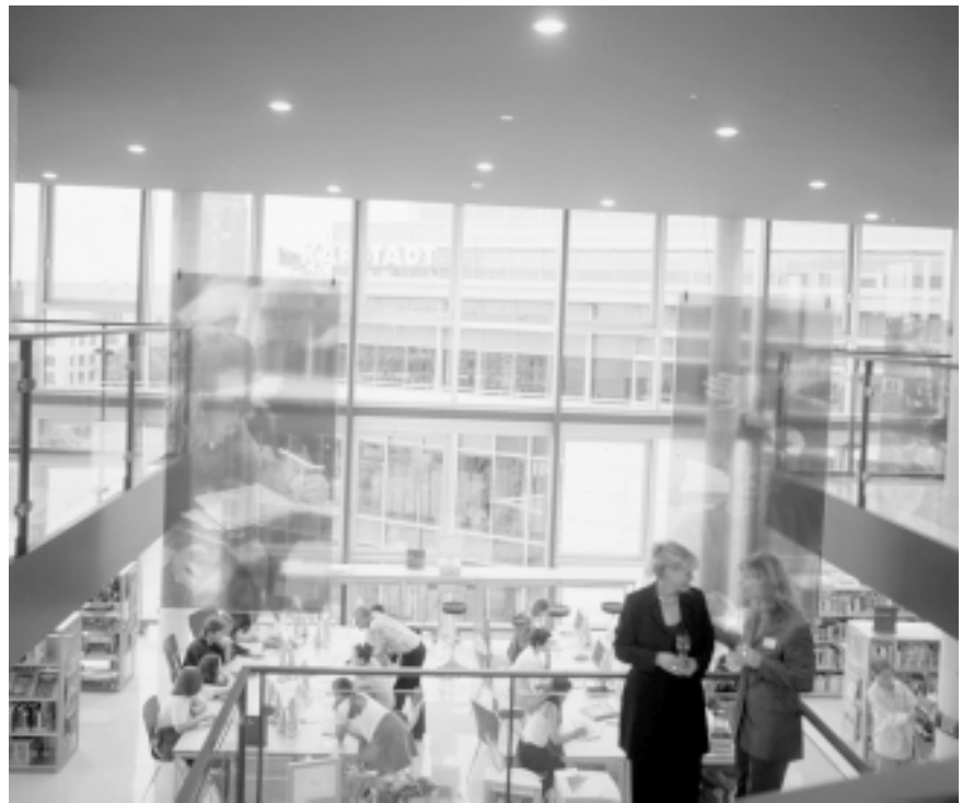
Einige Gäste der Eröffnungsfeier hatten die Sektkgläser noch in der Hand, als die jugendliche Kundschaft die Räumlichkeiten bereits in Beschlag nahm – Blick von der zweiten Etage in den unteren Raum, in der Mitte die PC-Arbeitsplätze, rechts und links Teile der Medienpräsentation.

Die Düsseldorf Architekten Ingenhoven und Overdiek haben auf die Potenziale dieser Etagen gestalterisch reagiert, indem sie das siebte Obergeschoss jenseits betriebswirtschaftlich optimierter Flächenverwertung als offene Galerie ausbilden ließen, die mit dem sechsten Obergeschoss über eine breite interne Treppe verbunden ist. Es ergibt sich ein